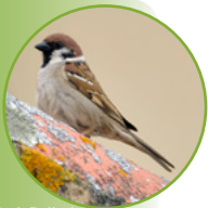
Moineau friquet

Suite à la raréfaction des insectes au printemps et en été, à celle des petites graines en hiver ainsi qu'à celle des cavités dans le bâti, les populations de Moineau friquet ont considérablement diminué en Deux-Sèvres. Toute observation sur cette espèce intéresse les ornithologues du GODS. Signalez vos observations sur www.faune-deux-sevres.org ou sur l'appli NaturaList .