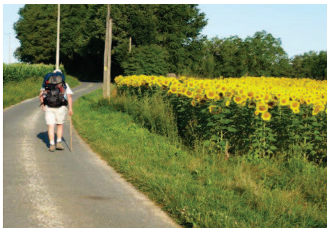
Entre Sorges et Périgueux