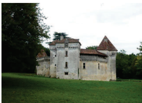
Château de Caussade