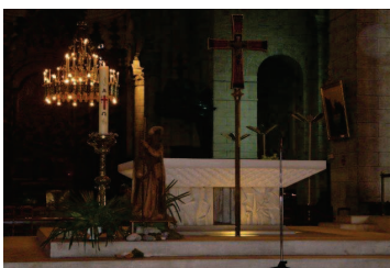
Cathédrale Saint-Front, Périgueux

22,8 – PERIGUEUX - Cathédrale Saint-Front