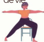
Yoga sur chaise

Accompagner la revitalisation profonde de l'organisme grâce au yoga, de façon très progressive, libérer l'énergie vitale retenue dans vos tensions et cultivez votre qualité de vie.